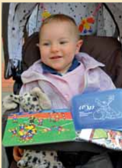
Die Freude der Kleinen über so viele Geschenke war groß.

terte Abnehmer fanden. Es gab allerdings auch Passanten, die lieber in ihre nicht ganz so gesunde Currywurst bitten als in einen knackigen Apfel. Von einer Gruppe Jugendlicher wurden die angebotenen Äpfel mit der Bemerkung „Viel zu gesund!“ abgelehnt, während andere Passanten aus der gleichen Altersgruppe den Biss in den Apfel nicht verschmähten. Bleibt nur zu hoffen, dass es bald unter allen Jugendlichen als „cool“ gilt, sich gesund zu ernähren.